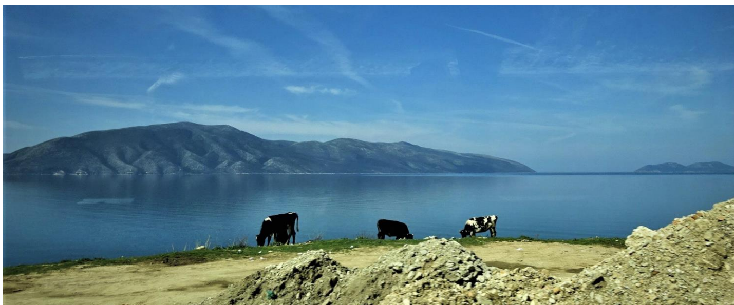
Vista sul Mar Ionio.

Viaggio tra storia, natura e società DAL 25 APRILE ALL'1 MAGGIO 2025